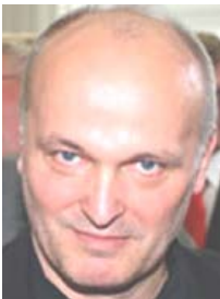
Minister of Justice Dr. Volker Schöneburg (‘Die Linke’)

Following a multitude of breaches and perversions of law by the Brandenburg judiciary against the diplomats, institutions and companies connected with the PRINCIPALITY OF SEALAND (see our documentation Brandenburgische Justiz Nr. 8 , complete, 32 MB) – the Prime Minister of the PRINCIPALITY OF SEALAND had on February 11, 2011, officially handed to the present Minister of Justice of the State of Brandenburg a comprehensive documentation in which the de jure- and de facto recognition of the PRINCIPALITY OF SEALAND by the FEDERAL REPUBLIC OF GERMANY as well by other states (like through legally valid agreements) is documented in detail.