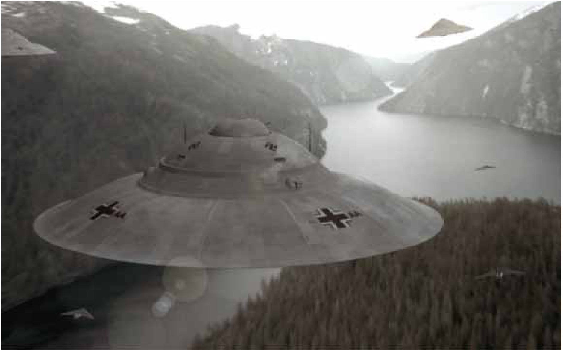
Mehrere Haunebu III im Testflug, begleitet von mehreren Nurflüglern