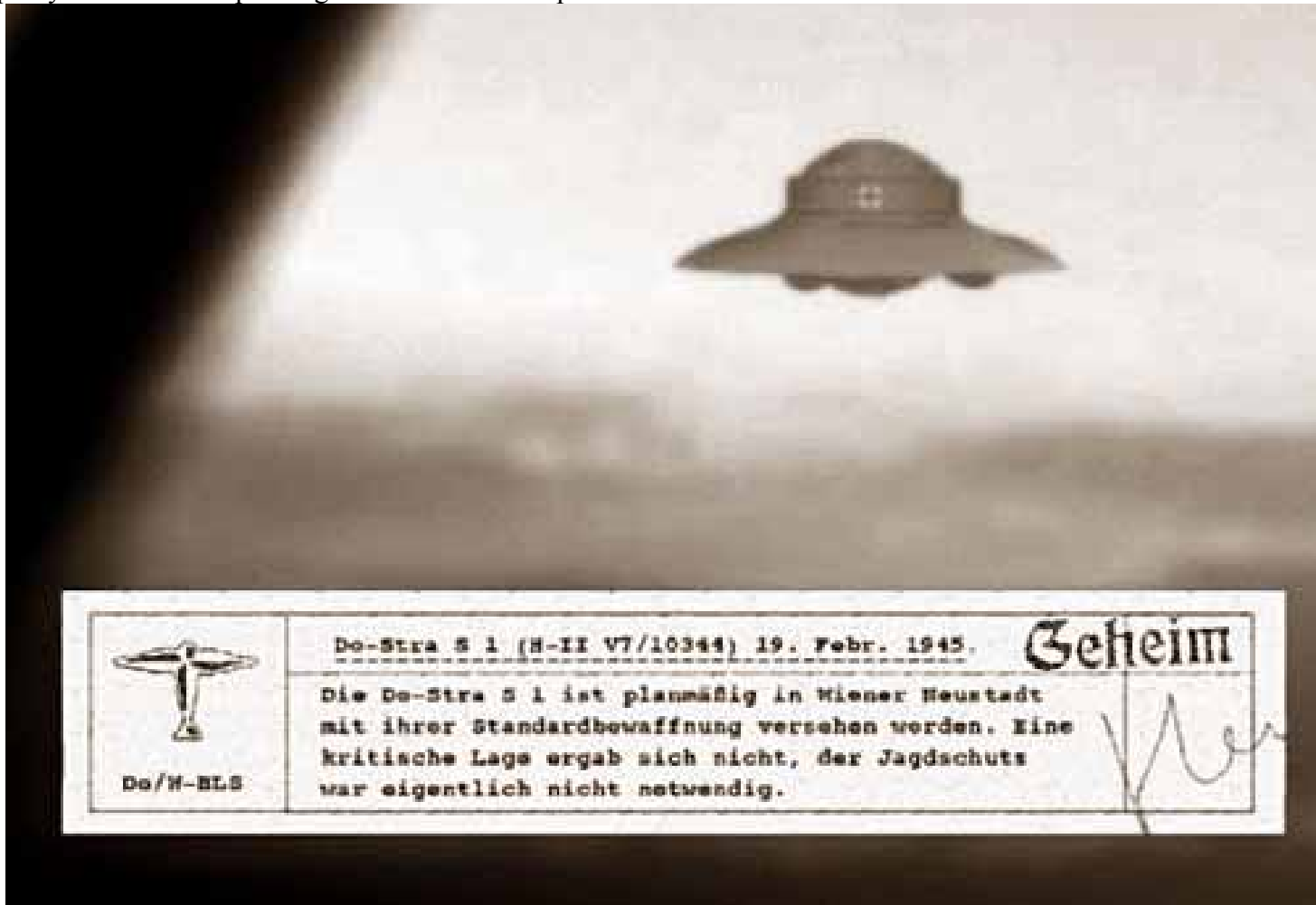
Haunebu II, 1945

Anlässlich des Artikels „Hitlers geheime UFO-Pläne“ in der Tageszeitung BILD und zugleich unter http://www.bild.t-online.de/BTO/news/2004/12/06/hitler_ufos/hitler_ufos.html am 6. 12. 2004 erlaubt sich die Regierungskommission VRILIA der "Principality of Sealand" – ohne den BILD-Artikel zu kommentieren –, einige Originalfotos von Flugscheiben, die während des Dritten Reiches entwickelt worden sind, zu veröffentlichen. Technische Daten werden zu gegebener Zeit nachgereicht. http://www.principality-of-sealand.eu/pdf/flugscheiben061204ori.pdf